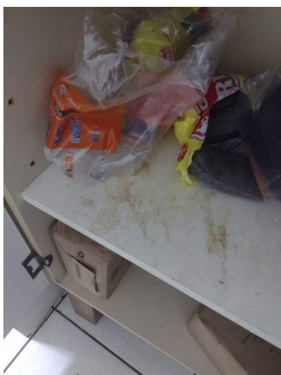
Armário de produtos de limpeza