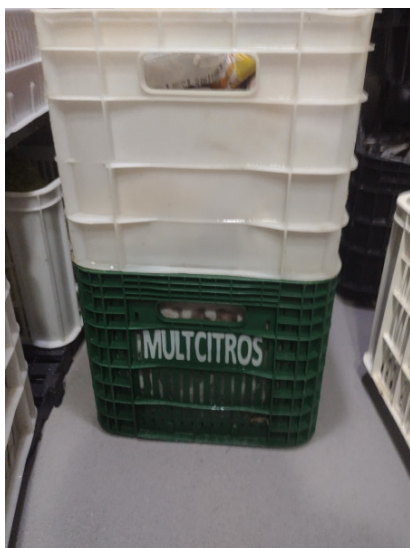
Caixa diretamente sobre o piso