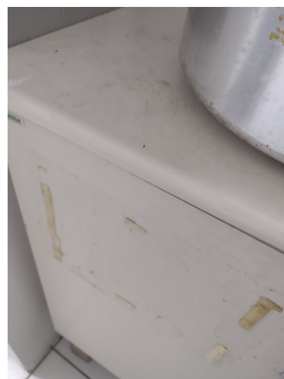
Porta parte externa