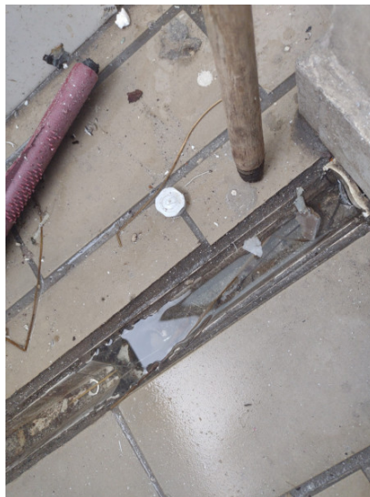
Cano aberto sem ralo