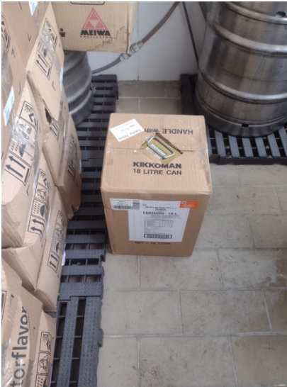
Produto diretamente sobre o piso