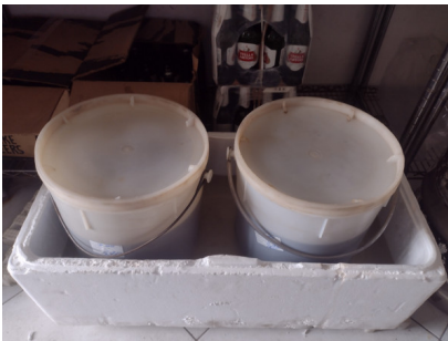
Chá em temperatura ambiente