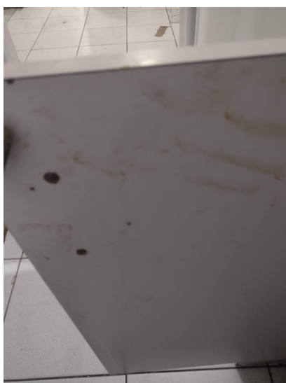
Porta parte interna