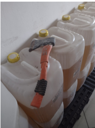
Ferramenta de manutenção