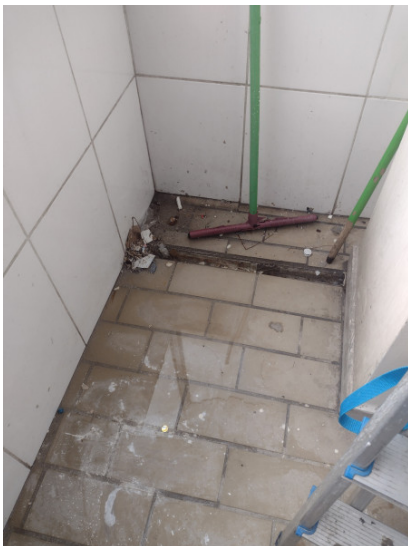
Cano exposto entupido