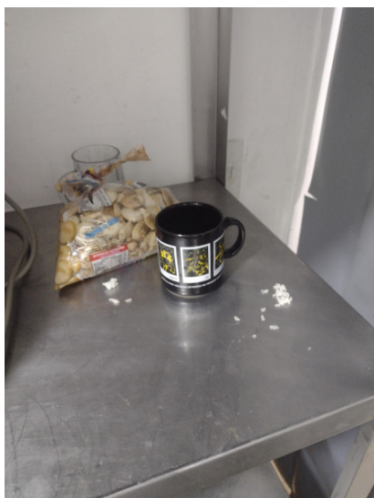
Prateleira com sujidades e itens pessoais